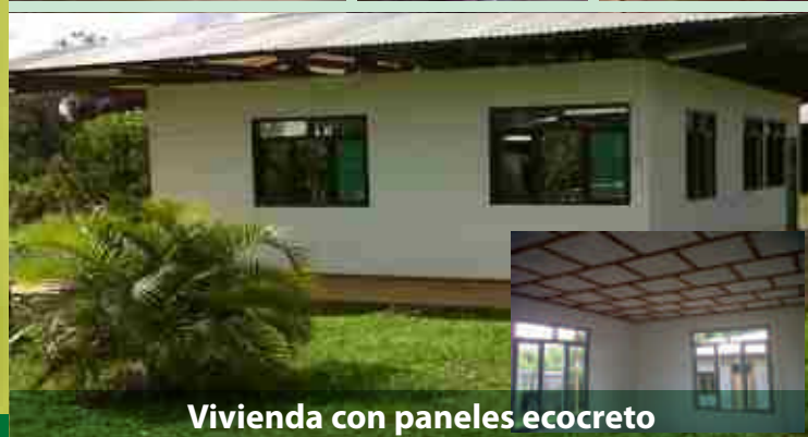
Vivienda con paneles ecocreto