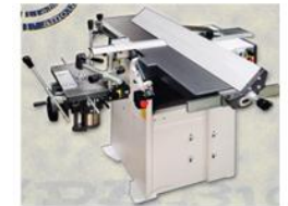
Cod: XSD-310 CEPILLADORA - GARLOPA