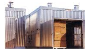
Cod: SECA001 SECADEROS PARA MADERA