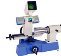
Cod: RONDAMAT AFILADORA